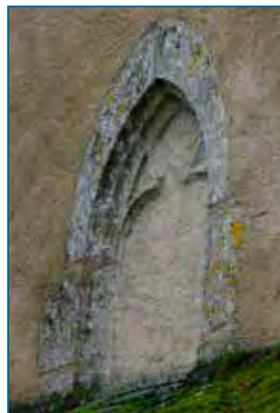
Vestige d'une ancienne fenêtre gothique