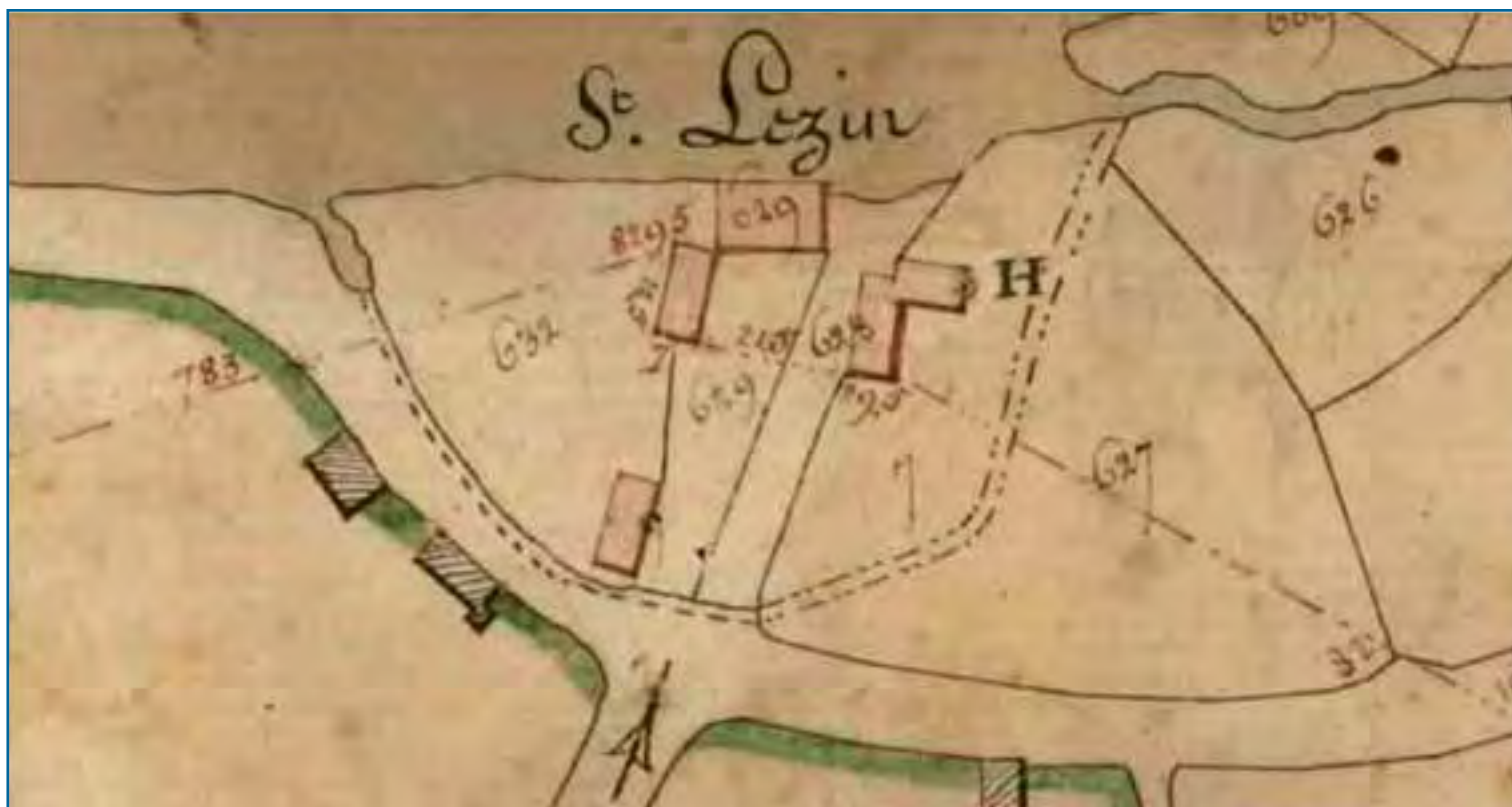
Saint Lézin extrait du cadastre établi en 1813 se situe à l'entée du camping des Varennes

De nombreuses activités se dérouleront tout au long de l'année Vous pourrez en prendre connaissance sur le site de Marçon http://www.ville-marcon.fr Retrouvez -nous aux journées du patrimoine les 16 et 17 septembre 2017