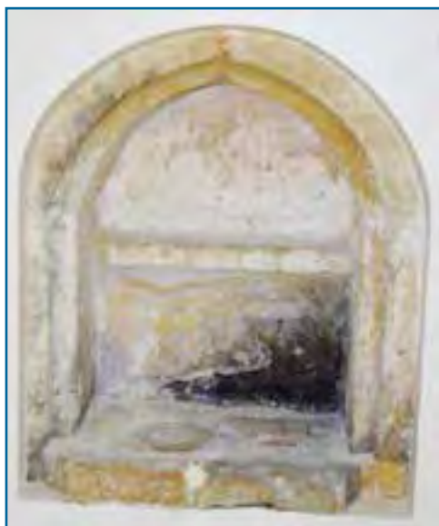
Ancien lavabo niche en pierre